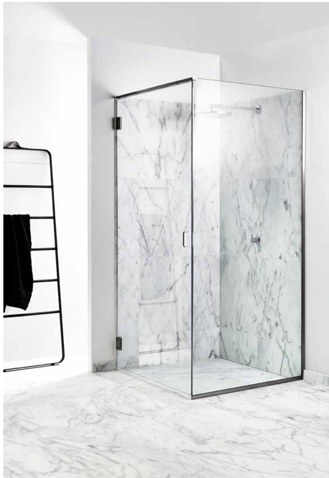
UNIDRAIN® GLASSLINE KOMPLETT DUSCHLÖSNING MED INTEGRERAT GOLVAVLOPP, HIGHLINE CUSTOM